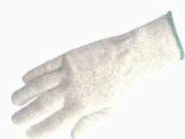
Sous gant textile fin