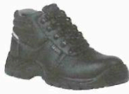
1 Paire de chaussure de sécurité