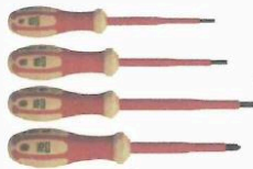
1 tournevis cruciforme Pozidrivbornéo n°1 1 tournevis cruciforme Pozidrivbornéo n°2 1 tournevis plat diamètre 3.5 longueur 100 mm 1 tournevis plat diamètre 5 longueur 150 mm