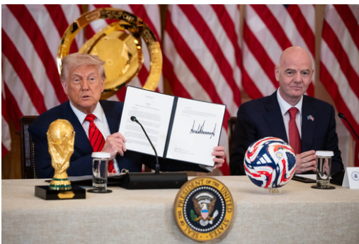
Le Président Donald Trump et celui de l'UEFA, Gianni Infantino.