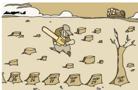
Amorim (Brésil) - Cartooning for peace

Si l'Union européenne ainsi que plusieurs pays d'Amérique latine et d'Afrique souhaitent progresser vers la sortie des énergies fossiles, ils se heurtent à l'opposition de grands producteurs comme la Russie et les pétromonarchies du Golfe, soutenus par certains pays émergents, notamment l'Inde, qui craignent une pénurie énergétique. La position des États-Unis, sous la présidence de Donald Trump, a également pesé sur les négociations. Retiré de l'accord, le pays ne semble pas accorder d'importance aux efforts internationaux, comme l'ont souligné plusieurs observateurs, évoquant aussi des pressions exercées sur la question des énergies fossiles. Lors de la séance plénière finale, le président de la conférence, André