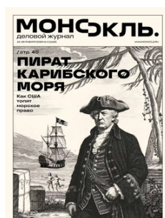
La Une de l'hebdomadaire russe Monocle , janvier 2026

La marine américaine intensifie ses bombardements en mer contre des embarcations accusées de transporter de la drogue. Le haut-commissaire des Nations unies aux droits de l'homme, Volker Türk, a qualifié ces actions d'« exécutions extrajudiciaires ». Elles ont causé la mort de plus de cent personnes (au 18 décembre 2025). Ces opérations se font en dépit de l'existence de droit de la mer, car elles se déroulent dans les eaux internationales.