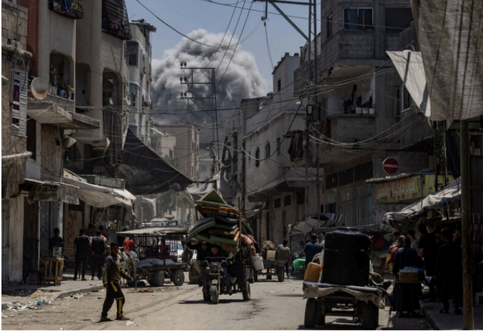
Trapped in Gaza : between fire and famine , © Saher Alghorra pour The New York Times et Zuma Press Gaza. Série de photographies lauréate du Prix Bayeux 2025 (Catégorie photo Jury International Nikon)