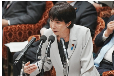
La Première ministre s'exprimant au sujet de Taïwan

Les critiques internationales s'expliquent également par la crainte d'une escalade des tensions. Une prise de position trop affirmée du Japon pourrait encourager une militarisation accrue de la région et accroître le risque de conflit, notamment dans le détroit de Taïwan, un espace stratégique essentiel au commerce mondial.