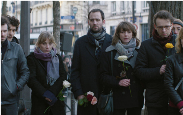
Un extrait de la série Des Vivants

l'effondrement, le silence, la reconstruction lente et chaotique des otages du Bataclan. En s'appuyant sur les témoignages authentique de sept rescapés, la série s'inscrit au cœur de ce dixième anniversaire, offrant non pas un récit héroïque, mais une plongée intime dans la vie de celles et ceux qui ont survécu, et qui tentent, encore aujourd'hui, de redevenir vivant.